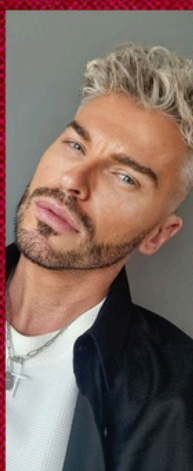
Dominique Roberts OMC világbajnok és Európa-bajnok sminkmester, nemzetközi tréner